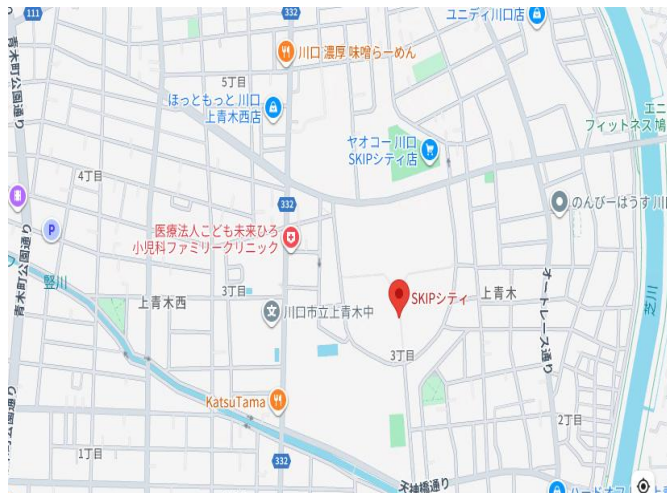
【※お車でご来場する場合の地図】